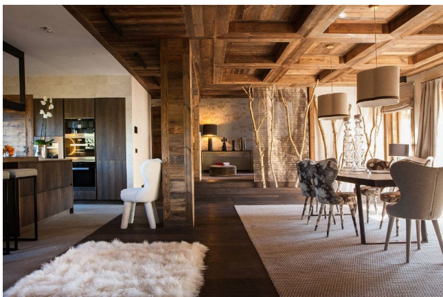
Интерьер дома Шале

В этой статье мы собрали примеры красивых одноэтажных домов, опубликовали фото, чтобы вы могли определиться с проектом своего будущего загородного дома и воплотили в реальность самые смелые идеи как в экстерьере, так и в интерьере.