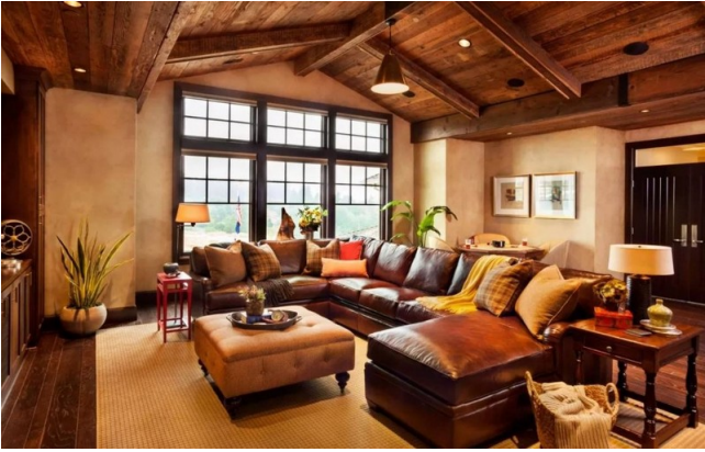
Интерьер рустикального дома