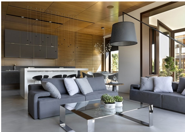
Интерьер современного одноэтажного дома