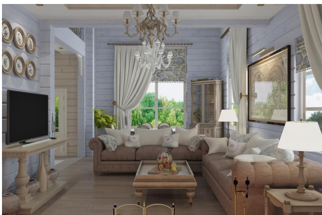
Интерьер дома в прованском стиле