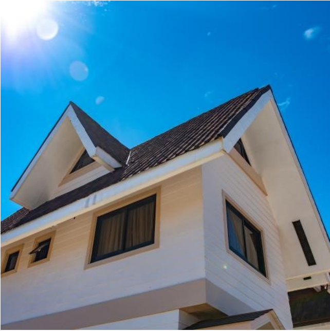
Ещё один пример дома с Ондувиллой на двускатной крыше.