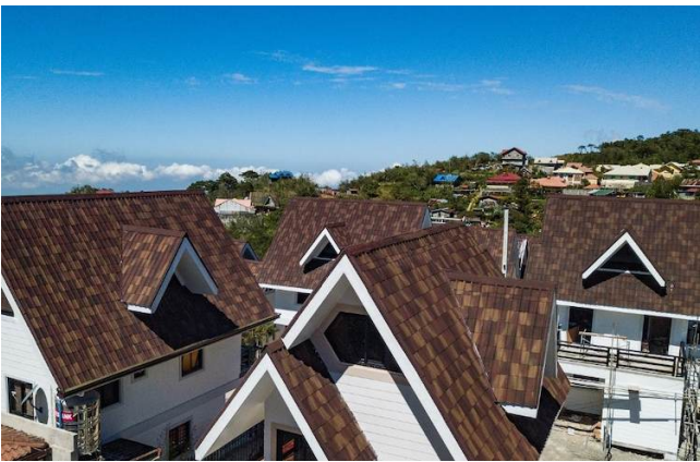
На фото коттеджный посёлок, крыши домов в котором покрыты Ондувиллой. Застройщик не впервые использует этот материал, знает о его преимуществах и поэтому вновь и вновь выбирает Ондувиллу.