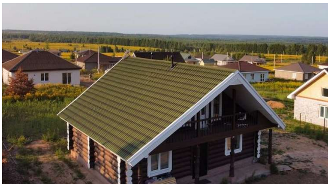
Двускатная крыша с зелёной Черепицей Ондулин.