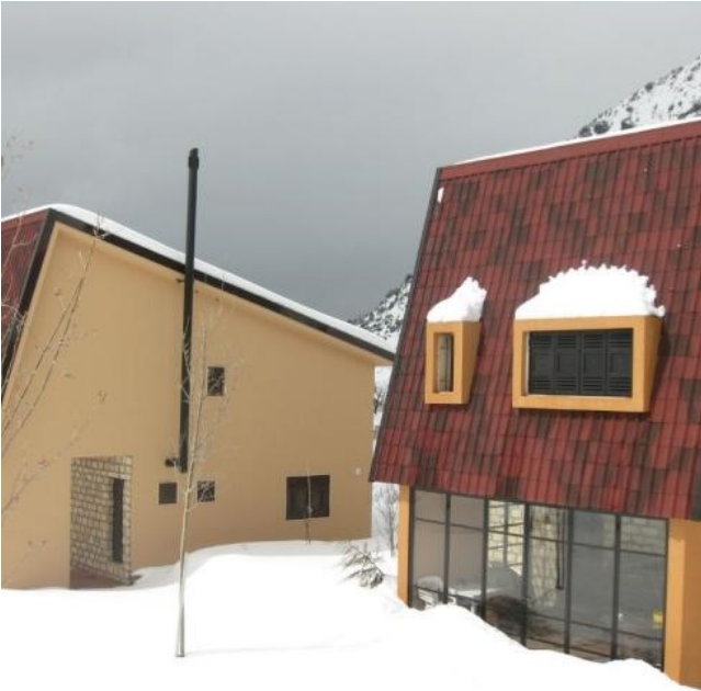
На фото небольшие загородные дома с Onduvilla на ассиметричной двускатной крыше.