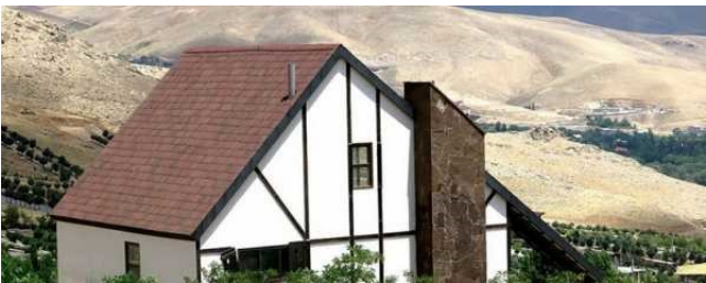
На этой фотографии видно, как Ондувилла превосходно сочетается с белым фасадом и камнем.