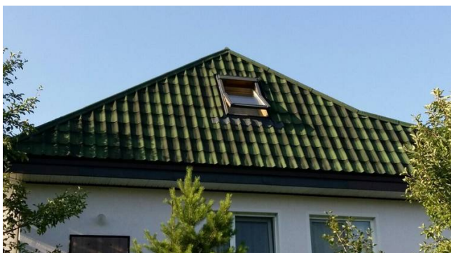
Мансардная крыша, покрытая Ондувиллой

Другими важными преимуществами являются: