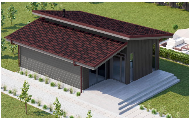
Ондувилла красный бархат

Если вам нравится вид натуральной черепицы, но вы ищете альтернативу, обратите внимание на Ондувиллу.