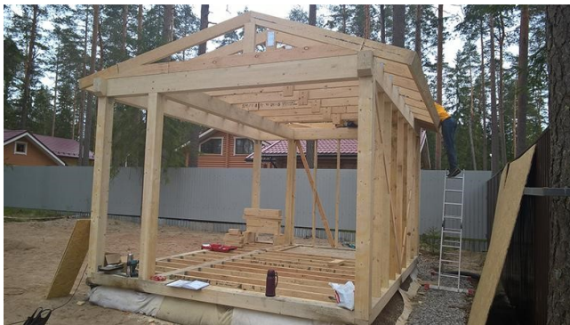
Схема сборки наглядно представлена на фото:

Обязательно обработайте все деревянные элементы фунгицидными пропитками или антисептиками. Это позволит избежать преждевременного разрушения древесины и продлит срок службы беседки.