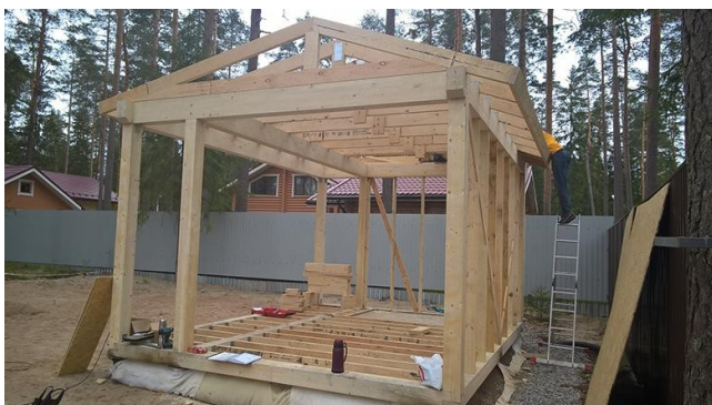
Схема сборки наглядно представлена на фото:

Обязательно обработайте все деревянные элементы фунгицидными пропитками или антисептиками. Это позволит избежать преждевременного разрушения древесины и продлит срок службы беседки.