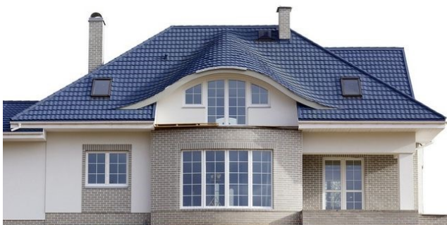
Фото-подборка домов с вальмовой крышей

Сложный уход за крышей, покрытой этим кровельным материалом, не требуется. Также Ондулин не трескается, практически не тускнеет со временем и не способствует появлению конденсата.