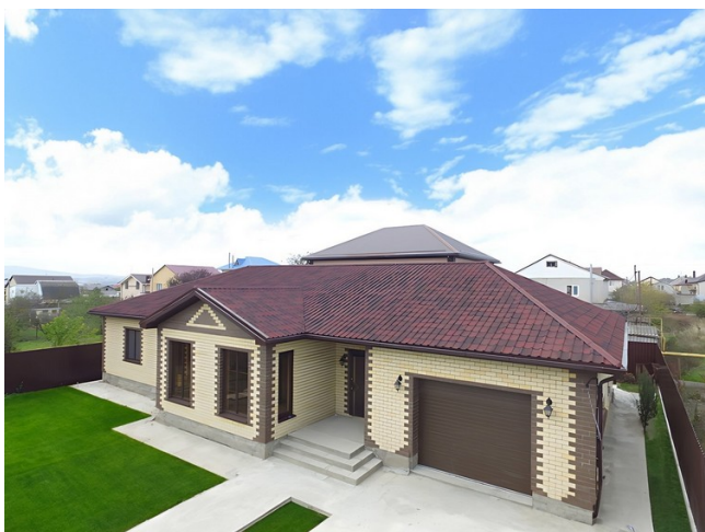
Бір қабатты үйге бекітілген гараж, Ондувилламен жабылған

Бірнеше өнім ондулин деп аталады. Оларға Onduline Smart, Onduline тақтайшалары және Onduvilla. Бұл материалдарды гараж төбесінің шатыры ретінде пайдалануға болады. Олар битуммен сіңдірілген целлюлозаның гофрленген парақтары. Парақтардың әртүрлі пішіндері мен профильдері бар, сонымен қатар олар сіздің сүйікті түстеріңізге боялған, бұл сіздің гаражыңыздың төбесін көрнекі және танымал ете алады.