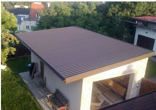
Гараж төбесі гофрленген жабынмен жабылған

Бұл материал қасиеттері бойынша металл плиткаларға ұқсас. Оны гофрленген парақ немесе гофрленген парақ деп те атайды. Гофрленген жабын қалыңдығы 0,35-1,2 мм мырышталған болаттан жасалған. Гофр биіктігі — 8-ден 75 мм-ге дейін. Парақтардың сыртқы бетінде сәндік полимерлі жабын бар. Сатып алу кезінде «С» әрпімен белгіленген гофрленген қабырға жабындарын қате сатып алмау үшін белгілерге назар аударыңыз. Шатырдың гофрленген жабыны «Н» әрпімен белгіленген. Бұл материал гараждың шатыры ретінде өте қолайлы.