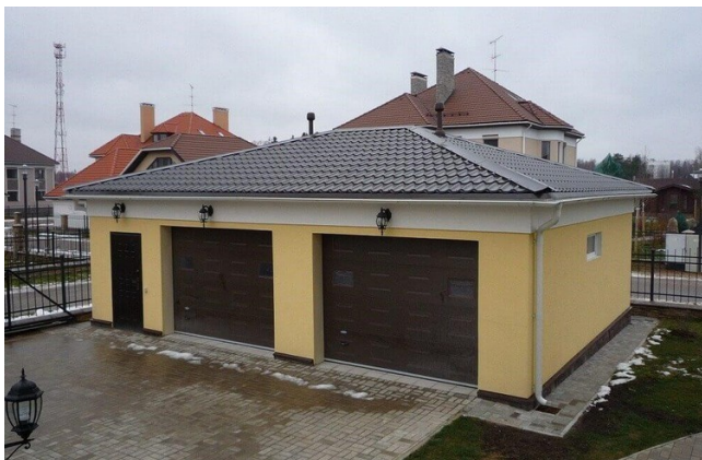
Гараж төбесіндегі металл плиткалар

Металл плиткамен қапталған гараж төбесі өте жақсы көрінеді. Бұл материал оның қолжетімділігі мен орнатудың қарапайымдылығы үшін бағаланады. Металл плиткаларды пайдалану бюджеттік опция деп санауға болады. Бұл шатыр материалының қызмет ету мерзімі орта есеппен 25 жыл, бірақ өте жоғары сапалы және қымбат металмен, сондай-ақ дұрыс жұмыс істегенде бұл кезең 50 жылдан асуы мүмкін. Өндірушілер шамамен 10 жыл кепілдік береді.