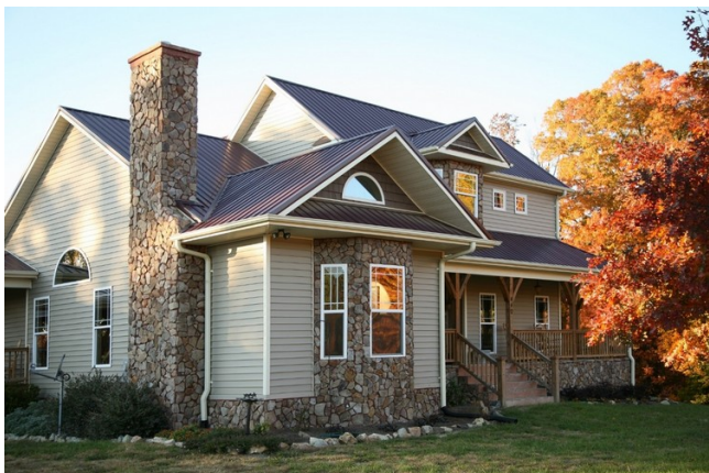
Сауалдық үй шатырының түпнұсқа көрінісі.