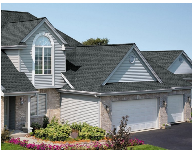
Бай және қымбат. Таңқаларлық сұр түсті біріктірілген шатыр үй ойластырылған стильді үйлесімді түрде толықтырады. Асыл сұр түс таспен әрленген қабырғалармен жақсы резонанс жасайды.