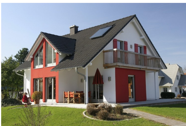
Түпнұсқалық дизайн және әйнек безендіру үйді көрнекі түрде тартымды етеді. Қабырғалардың кейбір бөліктерінің терракоталық түсі үйдің стилін ерекше етеді.