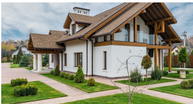
Фото-топтамада қала сыртындағы үйлердің заманауи жобалары ұсынылған. Сіз Ресейде салынған коттедждердің қасбеттерін безендірудің ең қызықты және ерекше идеяларын көресіз. Сәулет шешімдері еліміздің әртүрлі аймақтарының климаттық ерекшеліктеріне бейімделген.