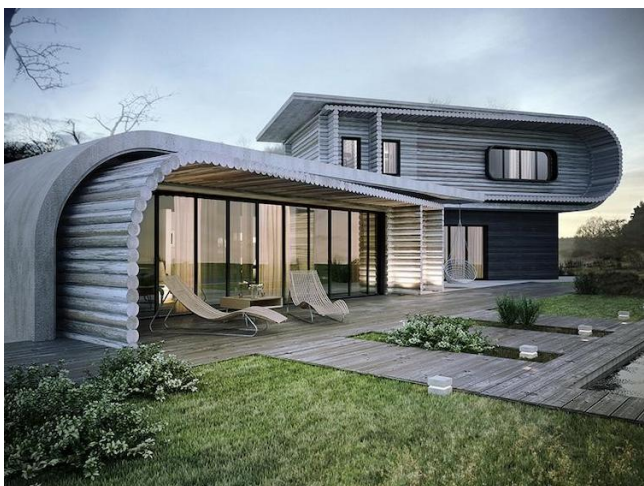
б. Жаңа көзқарасдөңгеленген бөренеге.