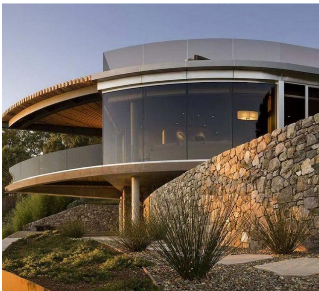
Фото дереккөзі: proekty-domov.me б. Максималды шыны, максималды кеңістік.