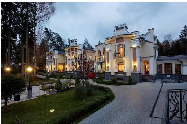
б. Мәскеу түбіндегі Art Nouveau стиліндегі зәулім үй.