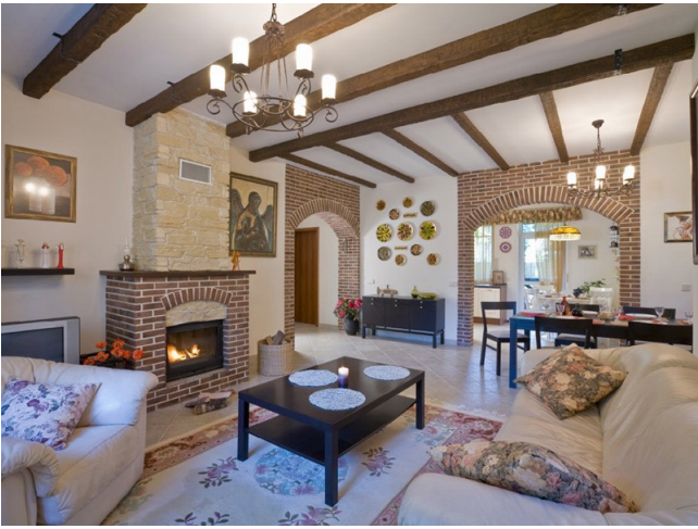
Інтэр'ер еўрапейскага загараднага дома