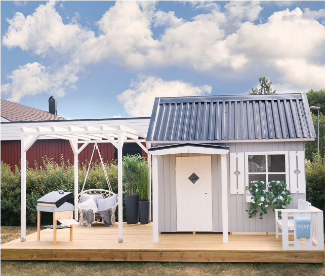
Гульнёвы домік з горкай