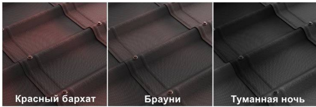
Каляровая лінейка Андівілы