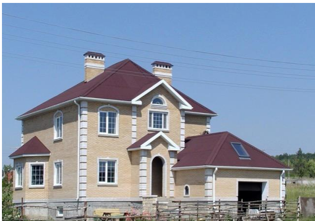
Праект дома з гаражом. На даху Андулін Смарт

Такія матэрыялы, як Андулін Смарт, Чарапіца Андулін і Ондувіла выдатна падыходзяць для даху гаража. Нягледзячы на тое, што яны валодаюць добрай устойлівасцю да працэкаў, ремонт усё ж часам патрабуецца.