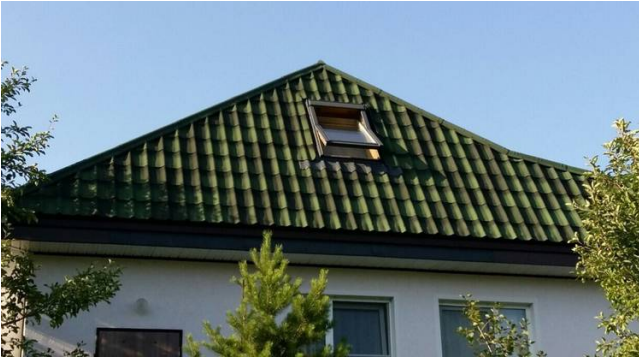
Мансардны дах, пакрыты Андувілам