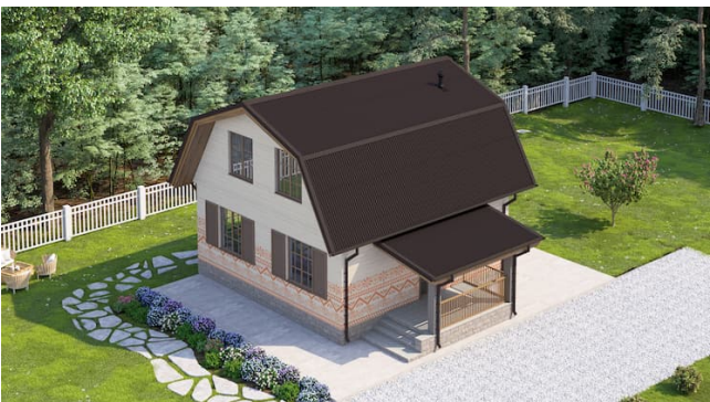
Андулін Смарт карычневага колеру на даху дома з мансардай

Як вам варыянты? Гатовыя да далікатных рашэнняў разам з андулінам?