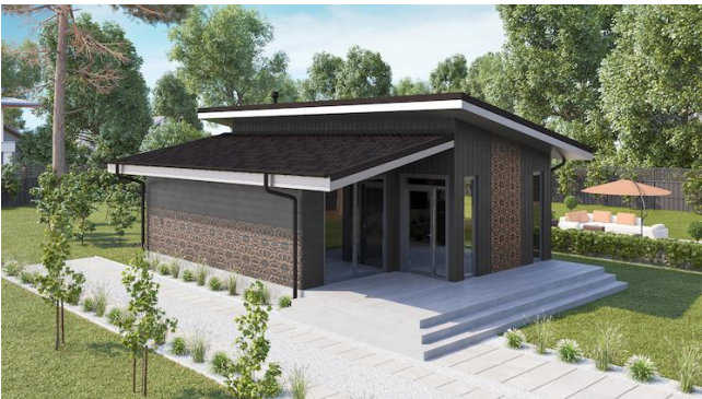
Ондувіла Брауні на аднасхільным даху