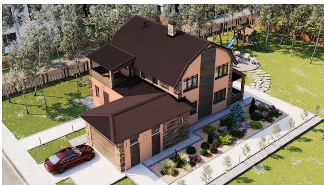
Андулін Смарт карычневага колеру на шматсхільным даху

Колер года 2024 — Peach Fuzz (персікавы пух) — далікатнае адценне аранжавага і ружовага, сімвал мяккасці і імкнення да клопату пра сябе і навакольных. Ідэальна для загараднага жыцця, праўда? І вельмі практычна! Светлы фасад не толькі візуальна павялічвае хату, але і змяншае энергаспажыванне на астуджэнне ўлетку, т.к. менш грэецца, чым цёмны.