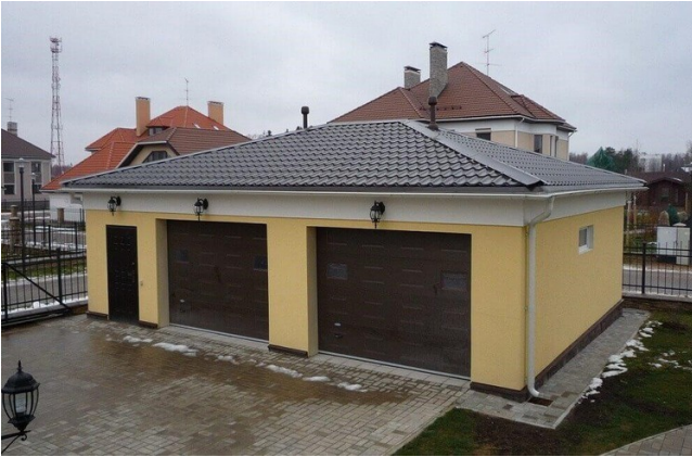
Металчарапіца на даху гаража

Дах гаража, пакрыты металадахоўкай, глядзіцца досыць добра. Гэты матэрыял шануецца за сваю коштавую даступнасць і нескладаны мантаж. Выкарыстанне металадахоўкі можна аднесці да бюджэтных варыянтаў. Тэрмін службы дадзенага дахавага матэрыялу складае ў сярэднім 25 гадоў, але пры вельмі якасным і дарагім метале, а таксама пры правільнай эксплуатацыі гэты тэрмін можа перавысіць 50 гадоў. Вытворцы даюць гарантыю каля 10 гадоў.