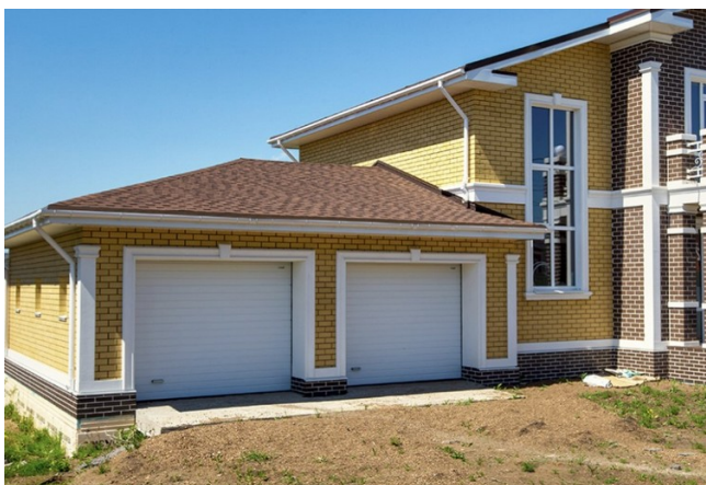
Гараж з мяккім дахам

Так называюць бітумную чарапіцу. Гэта адзінкавы матэрыял, які ўкладваецца внахлест на суцэльную падставу. Вырабляюць гнуткую чарапіцу з нятканага стеклохолста, пакрытага бітумам. Зверху маецца вобмешка з афарбаванай каменнай крошкі. Яна адказвае за колер мяккага даху, а таксама за абарону ад ультрафіялетавых прамянёў. Выбіраючы мяккі дах для гаража, трэба надаваць адмысловую ўвагу якасці матэрыялу. Ён павінен добра спраўляцца з тэмпературнымі ваганнямі і ўздзеяннем сонечных прамянёў. Не варта эканоміць на гэтых характарыстыках.