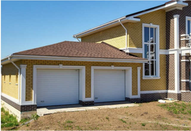
Гараж з мяккім дахам

Так называюць бітумную чарапіцу. Гэта адзінкавы матэрыял, які ўкладваецца внахлест на суцэльную падставу. Вырабляюць гнуткую чарапіцу з нятканага стеклохолста, пакрытага бітумам. Зверху маецца вобмешка з афарбаванай каменнай крошкі. Яна адказвае за колер мяккага даху, а таксама за абарону ад ультрафіялетавых прамянёў. Выбіраючы мяккі дах для гаража, трэба надаваць адмысловую ўвагу якасці матэрыялу. Ён павінен добра спраўляцца з тэмпературнымі ваганнямі і ўздзеяннем сонечных прамянёў. Не варта эканоміць на гэтых характарыстыках.