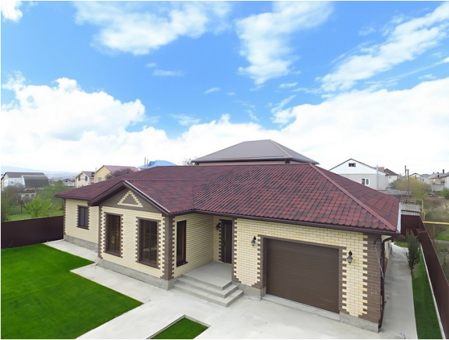
Прыбудаваны да аднапавярховай хаты гараж, пакрыты Андудвілай

Андудлінам называюць адразу некалькі прадуктаў. Да іх адносяць Андудлін Смарт, Чарапіцу Андудлін і Андудвілу. Гэтыя матэрыялы можна выкарыстоўваць у якасці даху для даху гаража. Яны ўяўляюць сабой хвалістыя лісты з целюлозы, прасякнутай бітумам. Лісты маюць розную форму і профіль, плюс да ўсяго гэтага яны афарбаваны ў самыя любімыя колеры, што можа зрабіць дах вашага гаража прыкметнай і вядомай.