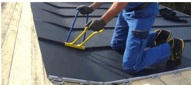
Монтаж фальцавага даху

Дах гэтага віду ўяўляе сабой ацынкаваныя сталёвыя лісты, злучаныя паміж сабой фальцавым метадам. Фальцом завецца адмысловы выгляд замкавага злучэння, пры якім дасягаецца высокая герметычнасць. Такія швы бываюць "ляжачымі". і «стаячымі» (гл. малюнак ніжэй).