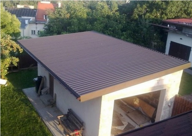
Дах гаража, пакрыты прафнасцілам

Гэты матэрыял па сваіх уласцівасцях блізкі да металадахоўкі. Таксама яго называюць профлістам або гафралістам. Прафнасціл вырабляюць з ацынкаванай сталі таўшчынёй 0,35-1,2 мм. Вышыня гофры — ад 8 да 75 мм. Вонкавая паверхня лістоў мае дэкаратыўнае палімернае пакрыццё. Пры куплі зважайце на маркіроўку, каб па памылцы не купіць сценавы прафнасціл, які пазначаецца літарай «З». Дахавы прафнасціл маркіруюць літарай «Н». Дадзены матэрыял цалкам падыходзіць у якасці даху для гаража.