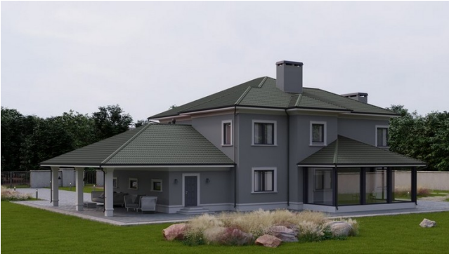
Праект дома з тэрасай і дахам, пакрытай Чарапіцай Андулін

Які дахавы матэрыял абраць для тэрасы? Існуе шмат розных варыянтаў на любы густ і колер, але мы рэкамендуем звярнуць увагу на Андулін Смарт, Чарапіцу Андулін або Ондувілу.