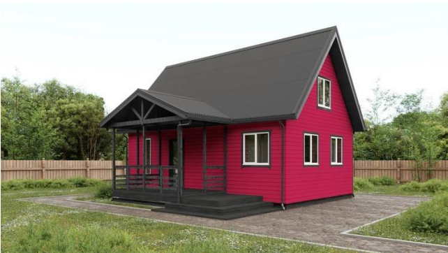
Дах пакрыты шэрым Андулінам Смарт