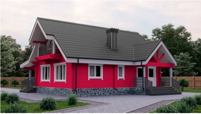
На мансардным даху Чарапіца Андулін колеру «Графіт»