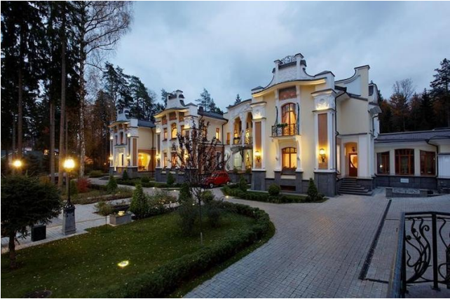
Падмаскоўны асабняк у стылі мадэрн.